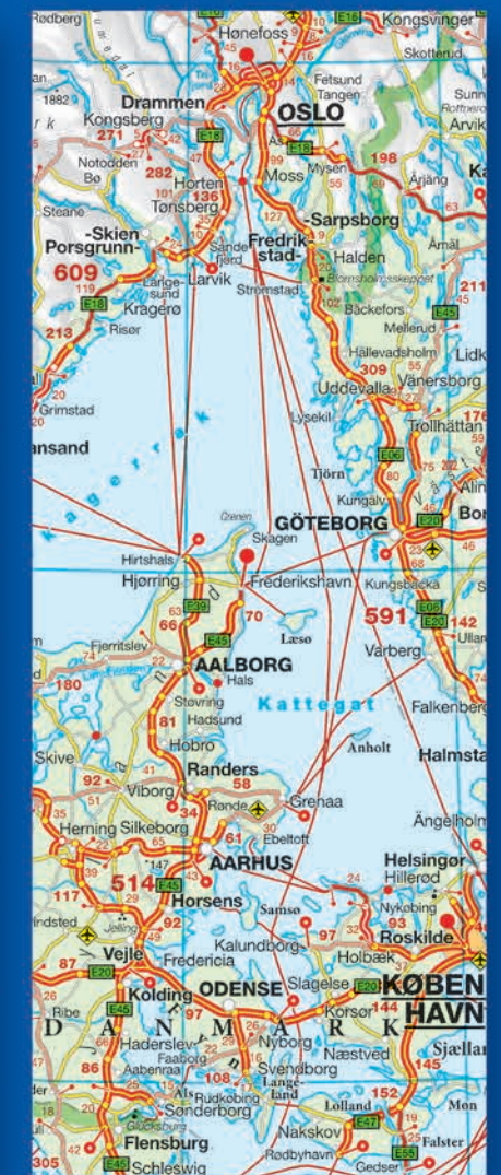
Europa Fernstraßen 1:4.500.000